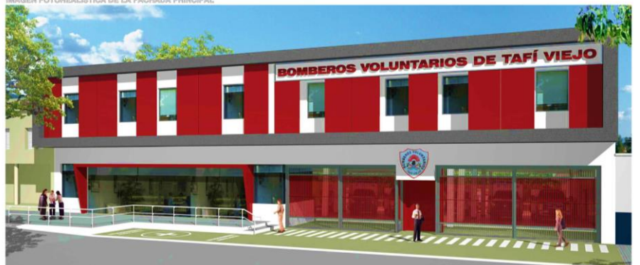
IMAGEN FOTOREALÍSTICA DE LA FACHADA PRINCIPAL